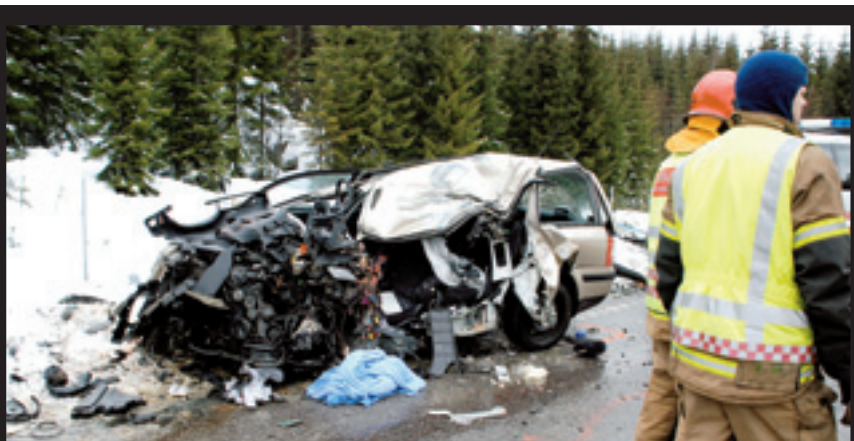
Dødsulykke på Harestua SIDE 7

ROA AUTO AS Postboks 94 • 2713 Roa • Tlf. 61 32 69 00 • Fax 61 32 69 10 www.roauto.no