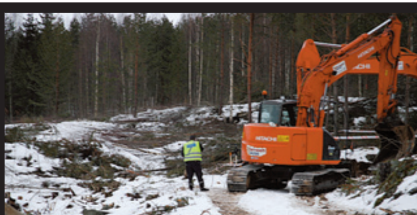
Dødsulykke i Jevnaker SIDE 5